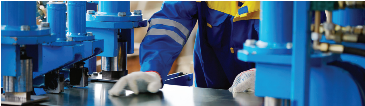
Verarbeitung eines Metallblechs an einer Presse

Fördermaßnahme „Rebound-Effekte aus sozial-ökologischer Perspektive“